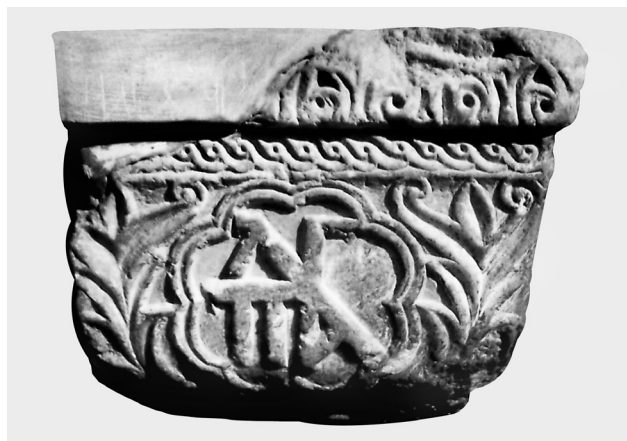
Fig. 4. Côté suivant du chapiteau. Monogramme des Paléologues.