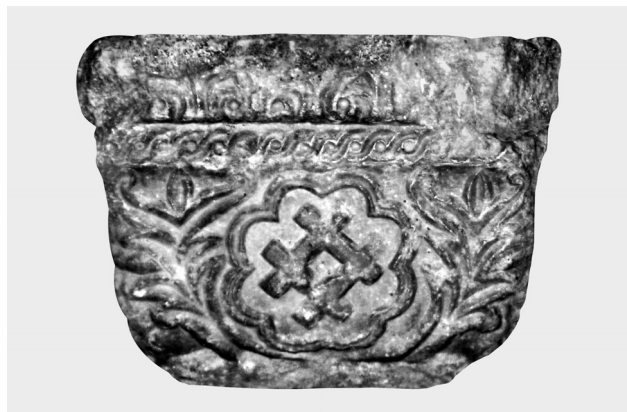
Fig. 6. Quatrième côté. Motif des barres parallèles.

moiries à ses sujets. Celles-ci étaient de libre adoption, laissées aux choix du possesseur. De plus, l'ancienne emblématique familiale et locale, généralement stable quant au symbole choisi, ne s'est jamais pliée aux exigences de la loi des émaux et des métaux du blason occidental, pour ne pas parler des meubles de l'écu qui, bien des fois, présentaient un aspect des plus insolites et hétéroclites du point de vue des normes héraldiques classiques 7 .