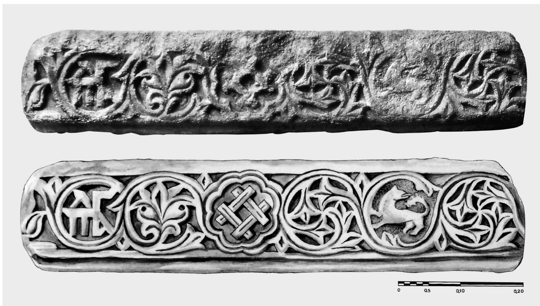
Fig. 7. Musée de la Culture Byzantine de Thessalonique. Épistyle du XIVe siècle (A. Tzitzibassi).

tion. Une rosace à huit lobes identique à celles du chapiteau est sculptée, tant sur l'épistyle du Musée Byzantin de Thessalonique publié par Tzitzibassi (Fig. 7) 28 et sur les impostes de chapiteau des fenêtres bilobées du côté ouest du déambulatoire de l'église des Saint-Apôtres à Thessalonique. Les deux rosaces (Fig. 8) renferment les monogrammes du patriarche Niphon, fondateur de l'église (1310-1314) 29 . Le type de la rosace qui porte le monogramme des Paléologues et les quatre barres pourrait être plus au moins contemporain ou un peu postérieur à ceux des Saints-Apôtres. Le même type de rosace enferme les mêmes emblèmes sur d'autres objets qui sont généralement attribués au XIVe siècle et à la première moitié du siècle suivant 30 .