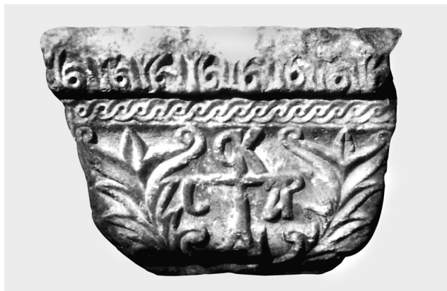
Fig. 5. Troisième côté du chapiteau: monogramme (O KAICAP).