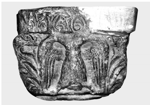
Fig. 3. Chapiteau. Aigle bicéphale.