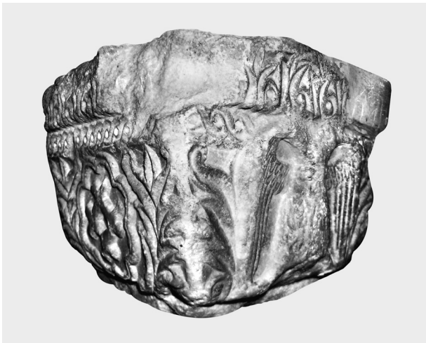
Fig. 1. Crypte de la basilique de Saint-Démétrios à Thessalonique. Chapiteau avec emblèmes impériaux des Paléologues.