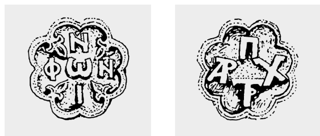
Fig. 8. Déambulatoire de l'église des Saint-Apôtres à Thessalonique. Médailles à huit lobes renferment les monogrammes du patriarche Niphon, fondateur de l'église ( Η Θεσσαλονίκη και τα μνημεία της, Thessalonique 1985, 100 ).

Le premier fut Jean, fils aîné de l'empereur Andronic II Paléologue et de son deuxième épouse (1284) Irène (Yolande de Montferrat, fille de Guillaume VII, marquis de Montferrat) 32 . Tout récemment - et contrairement à d'autres chercheurs qui plaçaient sa naissance en 1286 - A. Failler proposa 1289 comme date de naissance de Jean 33 . Irène (1274-1317) entretenait des liens familiaux avec la ville de Thessalonique, car la maison lombarde de Montferrat 34 revendiquait ses anciens droits dans la ville qui les avait obtenus depuis le temps de sa domination latine 35 . L'impératrice, dans l'intérêt de ses fils réclama (selon Nicéphore Grégoras) un partage du territoire impérial entre tous les princes impériaux, d'après le modèle féodal occidental 36 . Andronic II, qui favorisait l'unité de l'empire grec, repoussa obstinément la proposition et rejeta les prétentions de son épouse. Le refus de l'empereur fut l'origine d'une grave brouille; Irène quitta la capitale et se rendit en automne de 1305 à Thessalonique 37 , où elle a résidé jusqu'à sa mort à Drama, en 1317. Avec l'arrivée d'Irène à Thessalonique, commence une autre période de gouverne-